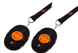
2 Badges Compagnons