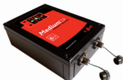
1 Antenne BOX