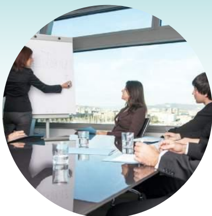
Sociétés de tous secteurs d'activité