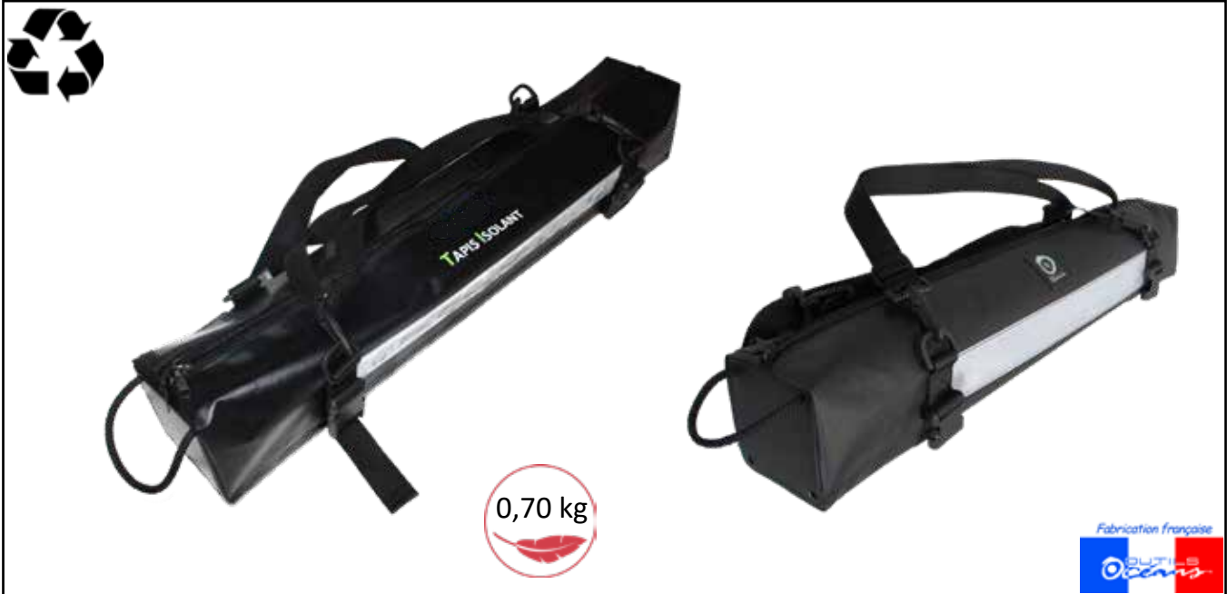
SAC POUR TAPIS ISOLANT - Ref : PO701111, CE, AN, 2BF