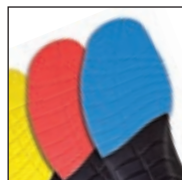
Vario Wide Fit System